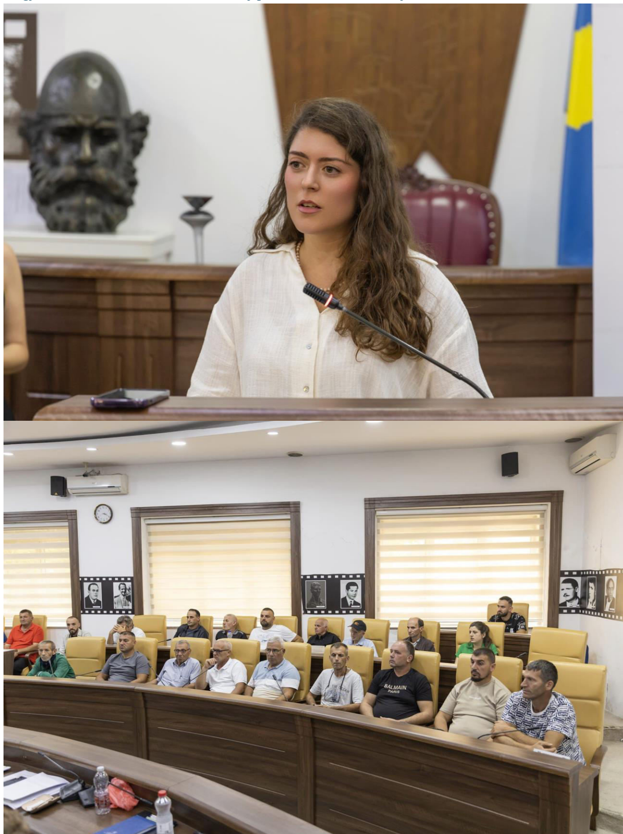
Dëgjimi Buxhetor me Komunitetin bujqësor të Komunës së Gjilanit, 29.08.2024