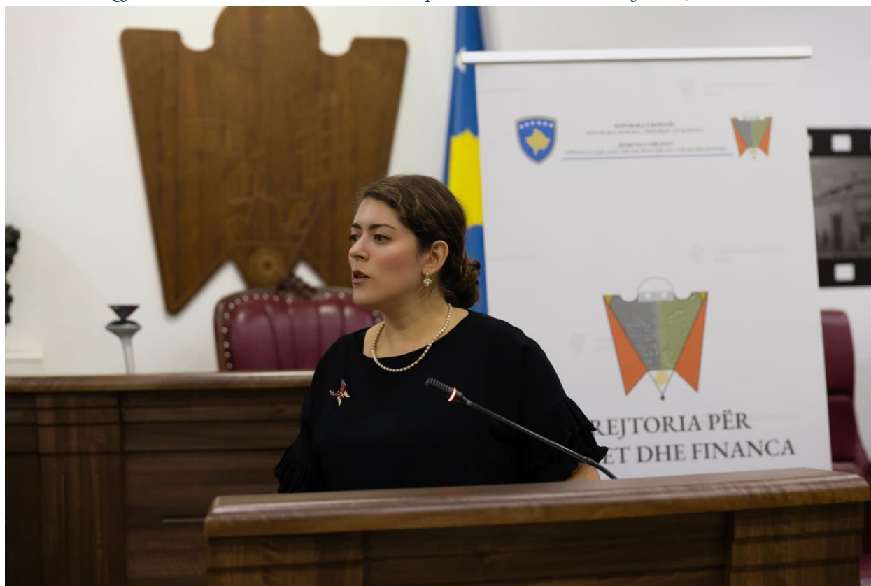
Dëgjimi Buxhetor me komunitetin e sportit të Komunës së Gjilanit, 29.08.2024