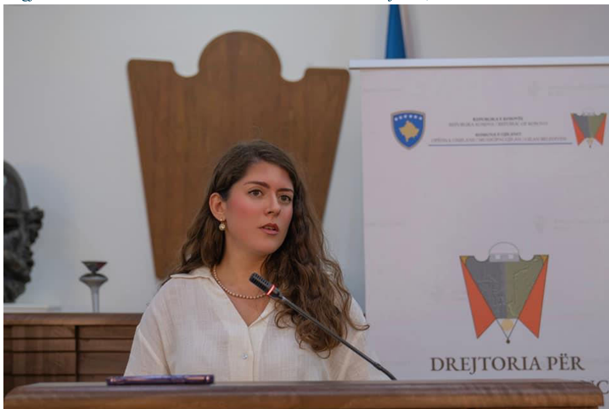
Dëgjimi Buxhetor me komunitetin e arsimit të Komunës së Gjilanit, 29.08.2024